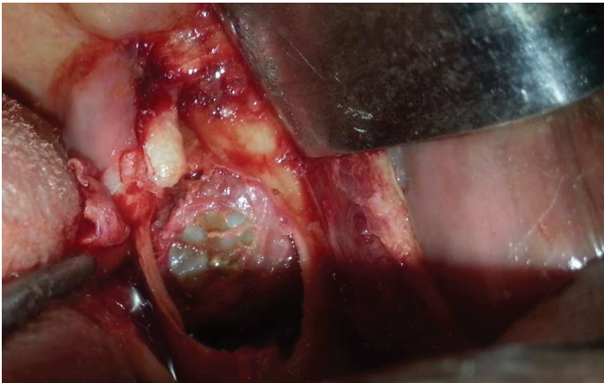
Fig 02 (a) : photographie per opératoire montrant l'énucléation kystique et l'extraction de la molaire