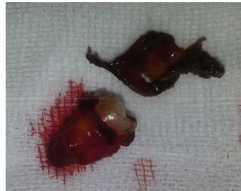
Fig 02 © : photographie montrant la pièce opératoire ( dent et poche kystique )