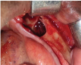
Fig 02(b) : photographie post énucléation montrant le site post chirurgical