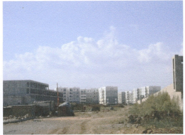
Fig. 2.9 Photo chantier d'un ensemble de logts sociaux à sidi M'hamed (près d'une ancienne ferme coloniale commune Ouled Chebel.