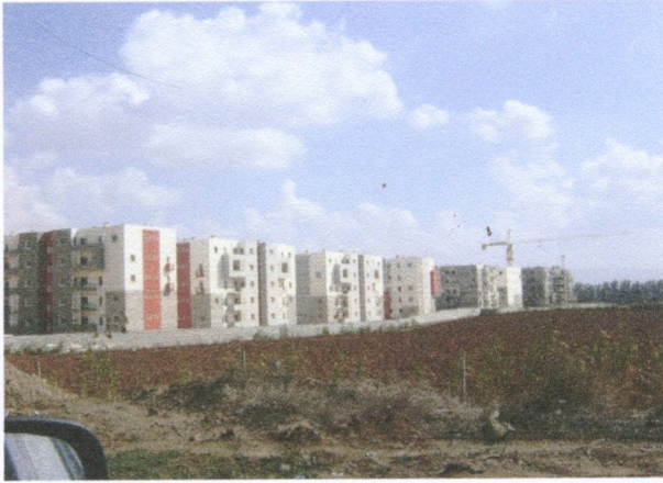
Fig. 2.8 Photo projet de 3216 lgts sociaux Chaibia (ancienne ferme coloniale commune Ouled Chebel.