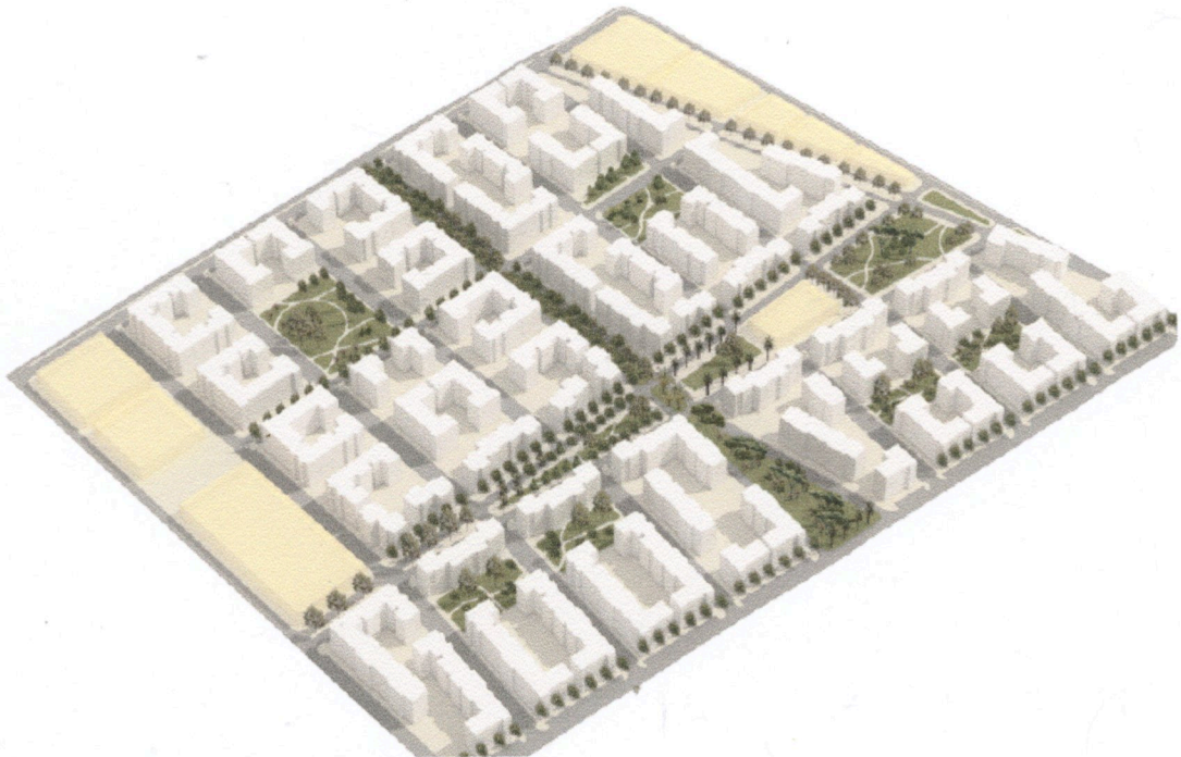
Fig.2.10 Maquette projet 3216 lgts sociaux