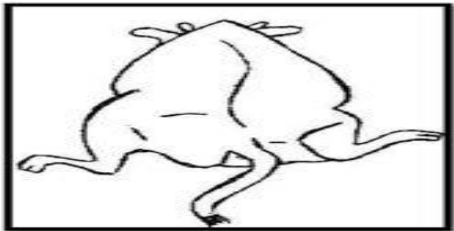
Figure 4 : Position en grenouille de vache atteinte d'une paralysie des nerfs obturateurs et de la racine L6 du nerf sciatique (Grisneau, 1999 ; Onnee, 2003).

Lésion touchant les nerfs obturateurs et les racines proximales du nerf sciatique : la vache est en position de grenouille, avec les postérieures dirigés vers l'avant (lésion typique de la paralysie du vèlage)(Grisneau, 1999 ; Onnee, 2003).