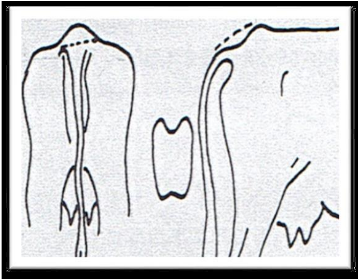
Figure 10 : luxation sacro-iliaque (Grisneau, 1999 ; Onnee, 2003).