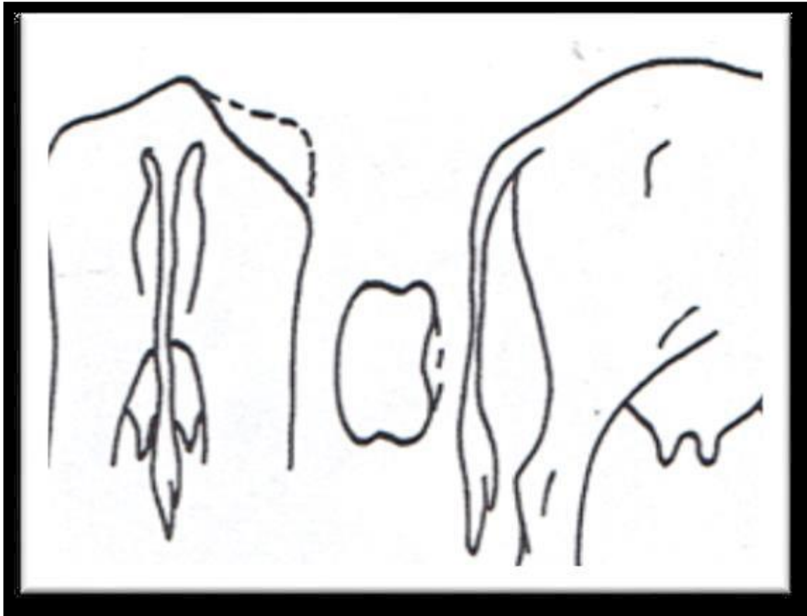
Figure 11 : Morphologie d'une vache présentant une fracture du col de l'ilium (Grisneau, 1999 ; Onnee, 2003).