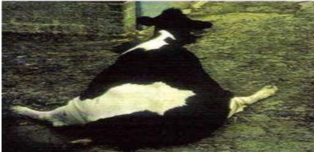
Figure 5: la position symétrique en abduction des membres pelviens caractéristique d'une paralysie bilatérale du nerf obturateur (Blowey et Weaver, 2003).