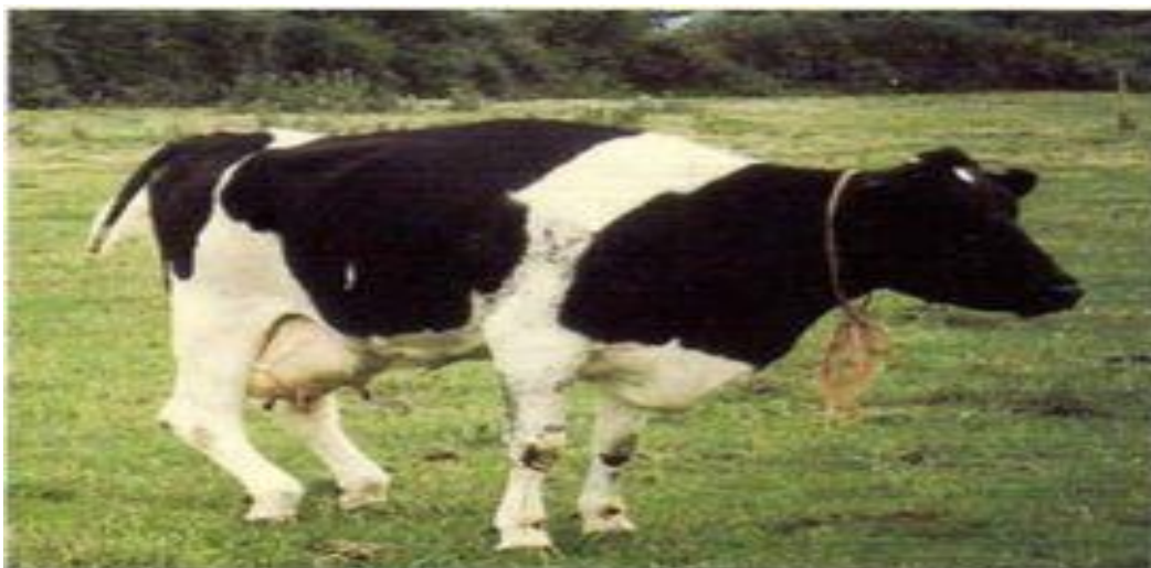
Figure 7: Photo d'une vache Holstein âgée de 6 ans atteinte de nerf sciatique (Blowey et Weaver, 2003).