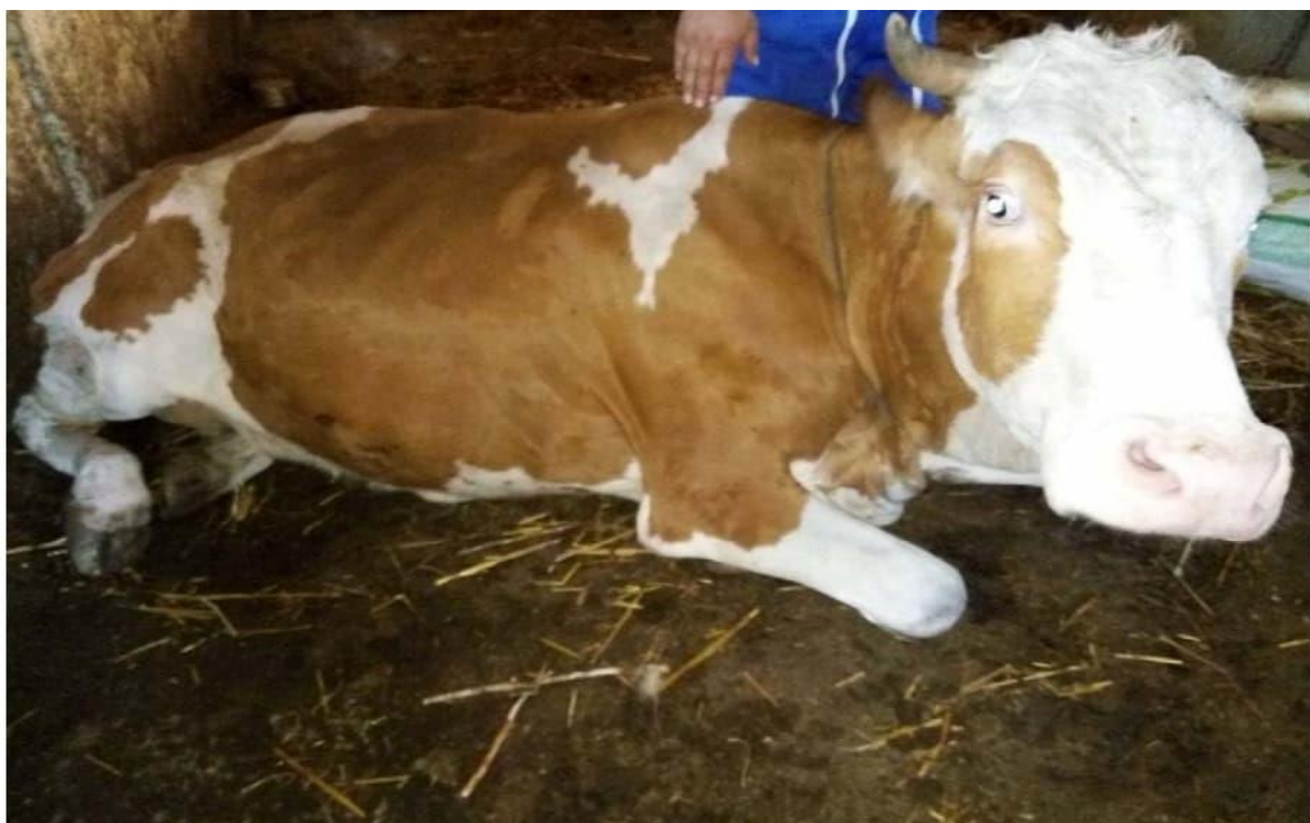
Figure 1 : une vache atteinte d'hypocalcémie (Dahoumane et Chetouani,2017)