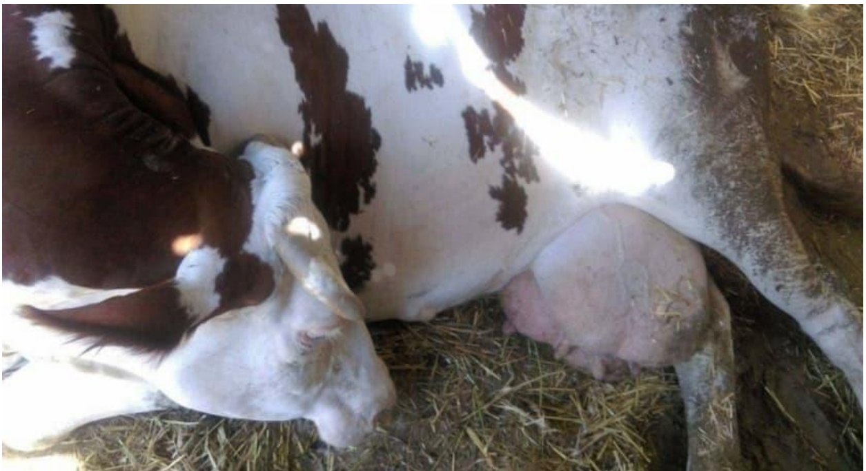
Figure 2: Une vache en décubitus atteinte de mammite colibacillaire (Dahoumane et Chetouani, 2017).