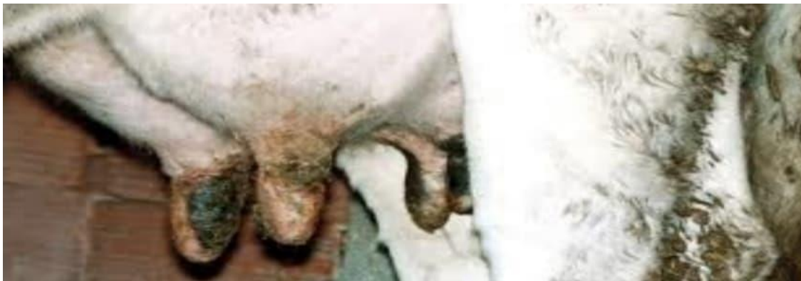
Figure 3: Photo prise d'une mammite colibacillaire (Dahoumane et Chetouani, 2017).

Enfin, l'infusion d'antibiotiques dans chacun des quartiers des toutes les vaches au tarissement est une méthode efficace et rentable (Fetrow et al. , 2000).