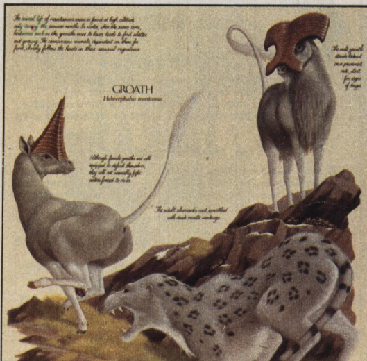
La vie sur Terre dans 50 millions d'années décrite dans un ouvrage (voir p. 159) d'"évolution-fiction" où le souci du détail le dispute à la rigueur fondée sur nos connaissances actuelles. Qui s'adapte et comment? Qui disparaît et pourquoi? Un détail : l'homme ne s'est pas adapté...