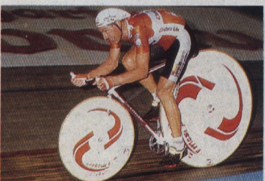
Le vélo « high tech » ? Un symbole de la percée des nouvelles technologies dans le sport. (p. 1128)