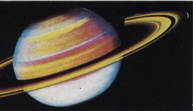
Rayonnement solaire et chaleur interne gouvernent les mouvements des atmosphères des planètes comme Saturne. (p. 1010)