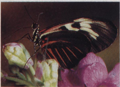
Le patrimoine génétique des fleurs et celui de leurs parasites évoluent-ils indépendamment ? (p. 1022)