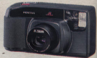
La 20 e édition de la Photokina, à Cologne, confirme le mariage de la photo et de la vidéo. Le point sur les tendances, les réussites et les curiosités des fabricants. p. 126