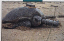
Nagent-elles chaque année plusieurs milliers de kilomètres en ligne droite ?