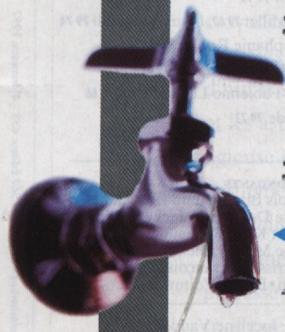
Eau potable, casseroles, médicaments... La peur de l'aluminium est-elle fondée ?