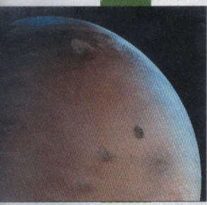
Les découvertes de la sonde Mars Global Surveyor révolutionnent notre compréhension de l'évolution de la Planète rouge.