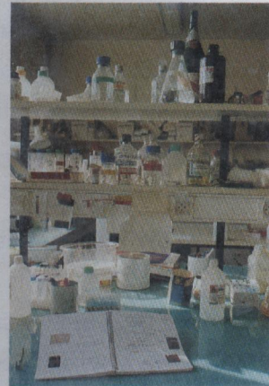
Le cahier de laboratoire est une pièce maîtresse des enquêtes menées en cas de fraude scientifique.