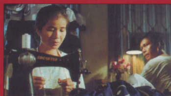
Cinécité p. 82