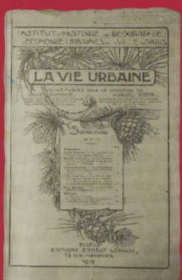
Archives : La Vie urbaine p. 93