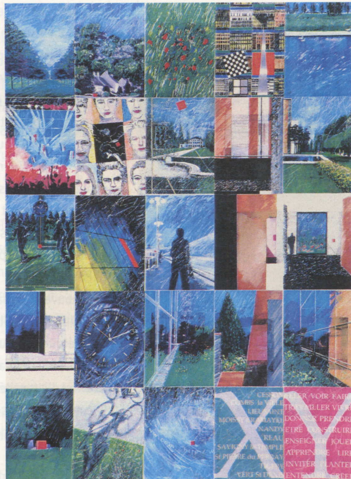
L'« abcdaire du Carré Sénart », par François Tirot.