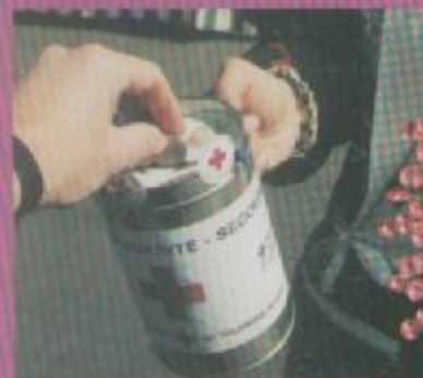
La psychologie de l'engagement