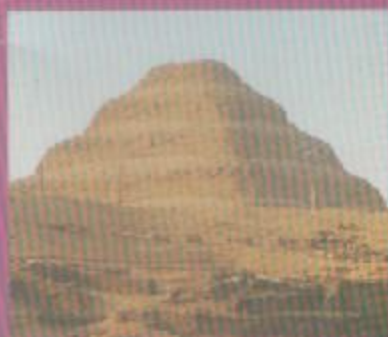
Le tombeau d'Akhetthétep