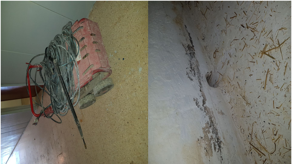
Photos 4,5 : matériels de désinfection, lutte contre les rongeurs (raticide).