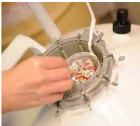
Figure 1 : congélation du sperme ( CPMA-U Liège ;2009 )