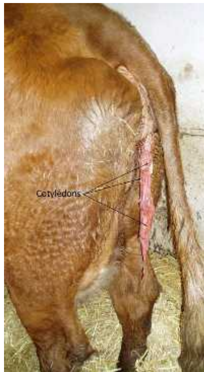
Figure 4 : Une non-délivrance du placenta

La rétention placentaire, également appelée non-délivrance ou rétention annexielle, correspond à la persistance prolongée des annexes fœtales dans l'utérus plus de 24 heures après l'expulsion du veau. Chez 75 % des vaches, la délivrance est spontanée au cours des 6 heures post-partum.