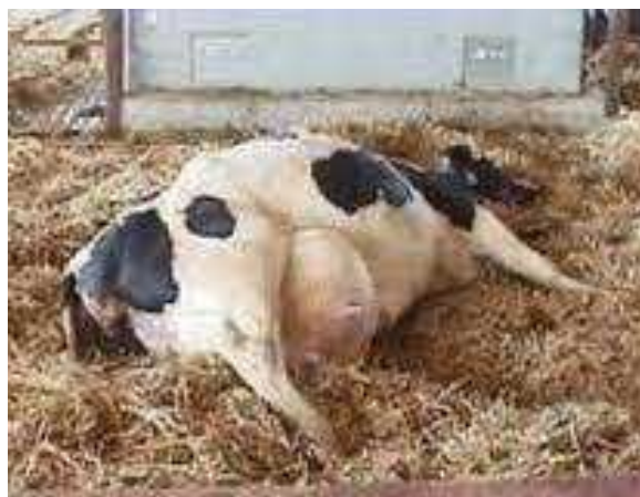
Figure 5 : Vache en fièvre de lait ( Ecole vétérinaire d'Alfort.2007 )

Les vaches en hypocalcémie sub-clinique sont souvent en déficit énergétique, avec un taux en AGNE augmenté. La présence d'une hypocalcémie ou d'un taux élevé en AGNE est associée à une reprise de la cyclicité plus tardive, à un taux de réussite en première IA réduit et un taux d'avortement en début de gestation augmenté. La baisse de la calcémie et le déséquilibre énergétique impactent les cellules immunitaire ce qui augmente la sensibilité aux infections et compromet la fertilité. Ce sont les affections utérines (fréquentes en cas d'hypocalcémie) qui jouent le plus grand rôle dans la baisse du taux de réussite en première IA et dans l'augmentation du taux d'avortement en début de gestation augmenté ( Ribeiro et al., 2013 ). En effet une vache présentant une fièvre vitulaire a entre 2 à 6 fois plus de risque de présenter une rétention annexielle ou une métrite qu'une vache saine. Correa(1990) a pu constater une relation entre fièvre vitulaire et cétose, amenant ainsi à des troubles de fertilité. Ainsi la fièvre vitulaire a une répercussion indirecte sur les performances de reproduction.