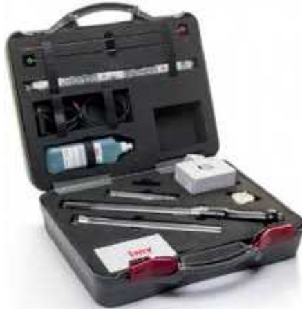
Figure 6 : Instruments de l'insémination artificielle (Elevage Biotech Maroc ;2005)

Le retrait rapide de pistolet ne peut permettre au sperme de coller de nouveau dans le vagin ; passant le pistolet le mouvement trop loin vers l'avant ou excessif du pistolet dans l'utérus pour endommager la doublure fragile de l'utérus. L'hygiène faible ayant pour résultat la contamination du pistolet, peut présenter d'infection dans l'utérus (Soltner, 2001).