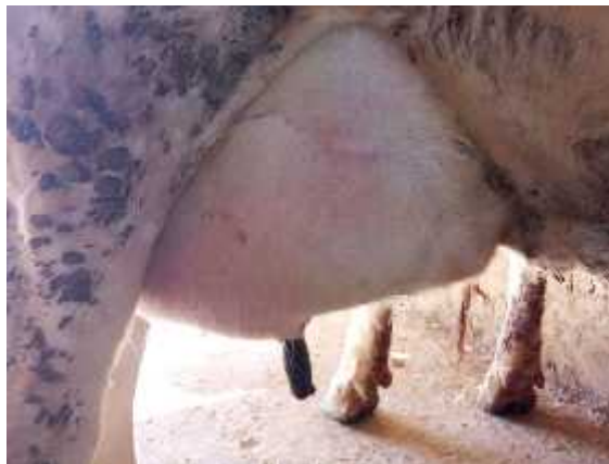
Figure 3 : Cas de mammite gangréneuse ( Plateforme Aladin.farm ; 2011 )

La mammite représente l'une des maladies les plus importantes dans l'industrie laitière. Il s'agit d'une inflammation de l'un ou de tous les quartiers de la mamelle. Elle entraîne une baisse de fertilité ; jusqu'à 50 pourcent des embryons sont perdus à la suite d'une mammite survenant dans les deux premiers mois de gestation ( Leblanc, 2004 )