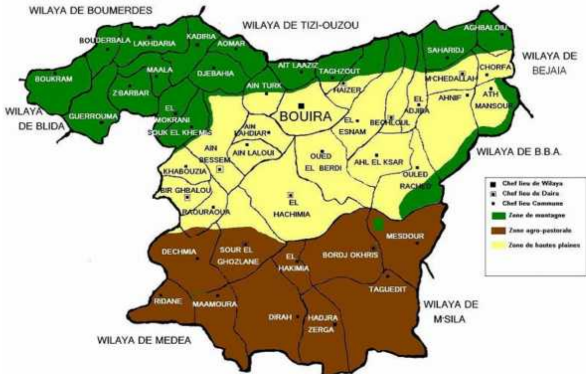
Figure 02 : Localisation des régions d'étude.

L'enquête du terrain a été réalisée au niveau de la Wilaya de Bouira durant la période qui s'étale de mois de Janvier jusqu'au mois de Mars 2020.