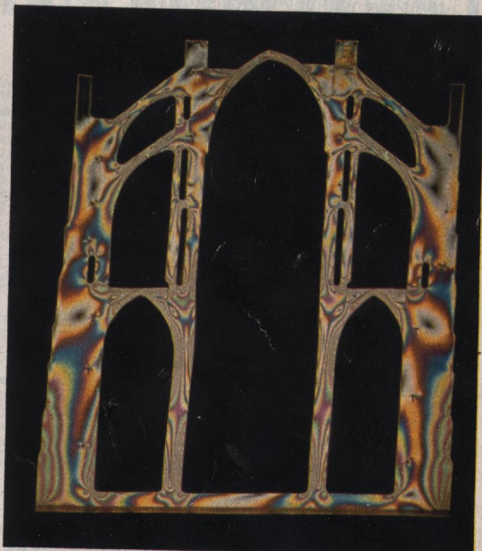
Les architectes du Moyen Age ne savaient le plus souvent ni lire ni écrire, et encore moins calculer. Or, les méthodes les plus élaborées d'analyse au polarimètre montrent que leurs cathédrales obéissaient à des lois rigoureuses et que c'est la perfection technique qui assurait la beauté de l'ensemble.