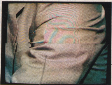
Supprimer les anomalies de couleur sur cette image de télévision : un pas vers la télévision de demain. (p. 898)