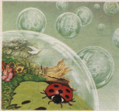
Comment sont apparues les premières formes de vie ? A cette question essentielle, la biologie moderne apporte un éclairage nouveau. (Dessin Fernando Cunha) (p. 878)