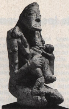
Comment dater les vestiges des civilisations mal connues comme cette maternité africaine ? Par la thermoluminescence... (p. 910)