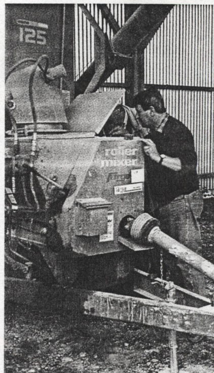
La graine de lupin est facilement utilisable à la ferme, aplatie ou grossièrement broyée