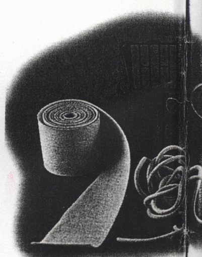
Divers produits non alimentaires réalisés à partir de lupin

la graine par une relation linéaire de type A \times MAT (g/kg MS) + B avec de forts coefficients de corrélation