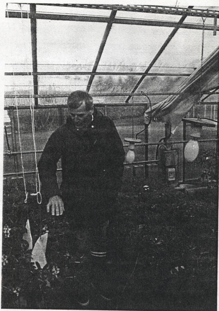
La sélection issue de l'INRA de Lusignan devrait apporter prochainement de bonnes variétés de lupin d'hiver.

L'ensemble de ces activités se poursuivra en 1999-2000 et seront redéfinies dans le cadre du prochain "Contrat de Plan Etat-Région".