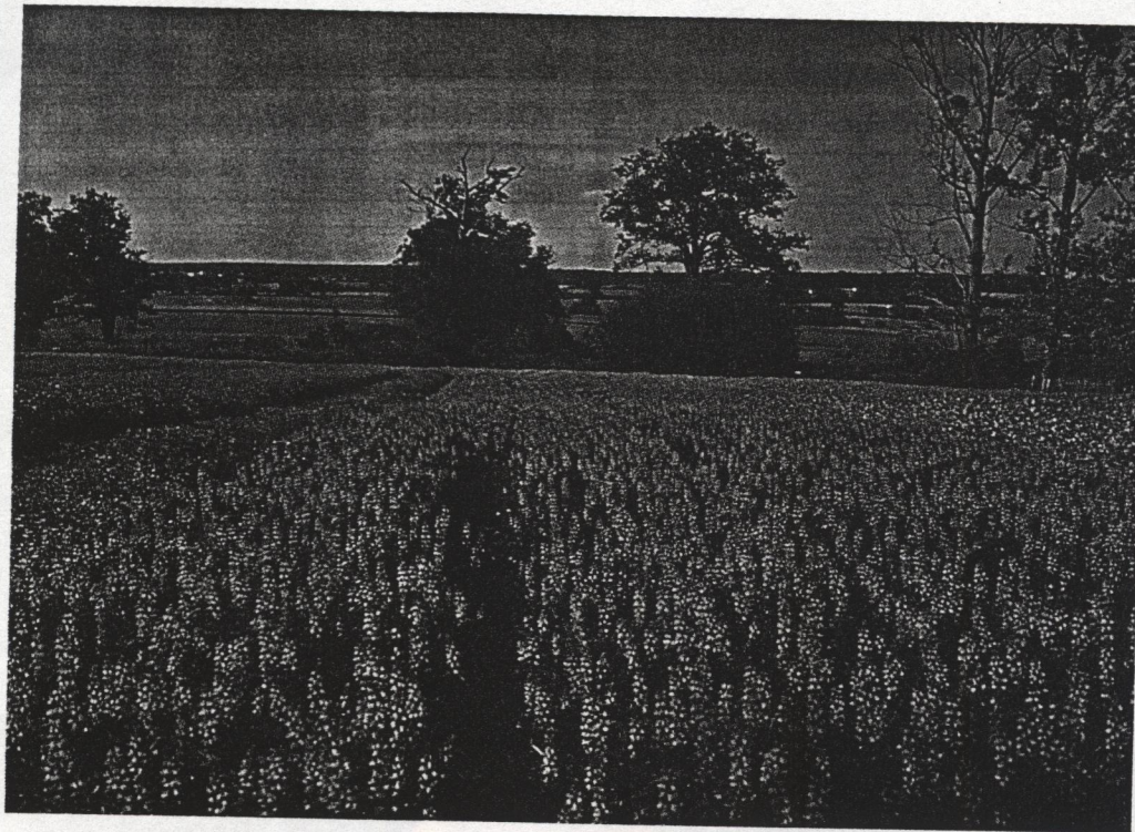
En aliments « bio », l'offre de graine de lupin produite en France est bien inférieure à la demande

↳ grossièrement ou en l'état, ne joue pas sur les performances des animaux (Faurie et al., 1992)