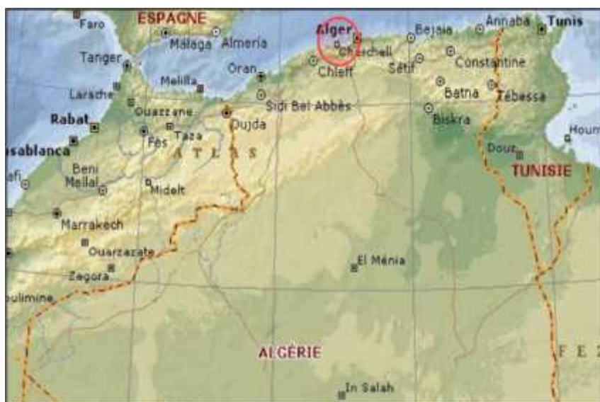
➤ Figure 1: la situation territoriale de Cherchell