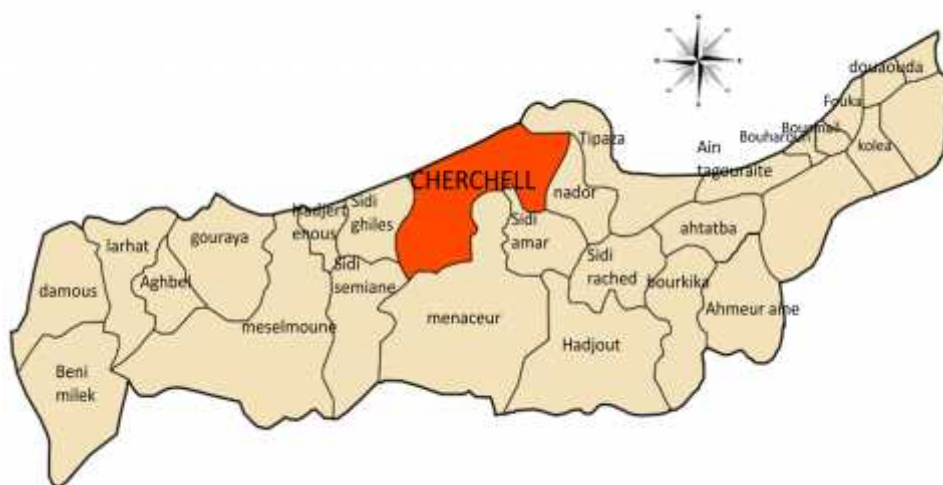
➤ Figure 2:carte de Cherchell

Cherchell dispose d'un potentiel touristique et d'un patrimoine historique important.