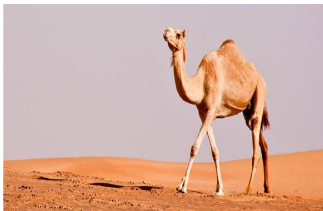
Figure 1 : Le dromadaire (Michele Solmi,2009) .

Par ailleurs, il a été indiqué que la production de chamelle est potentiellement supérieure à celle de la vache dans les mêmes conditions climatiques et alimentaires. C'est ainsi qu'en Ethiopie où FAYE (2004) signale que les pasteurs Afar qui élèvent simultanément bovins et camélins obtiennent une production laitière quotidienne moyenne de (1-1,5) litre avec le zébu Afar contre (4-5) litres avec la chamelle Dankali. La particularité du lait de chamelle réside dans sa teneur en matière grasse naturellement basse, avec 40% moins de cholestérol que dans le lait de vache.