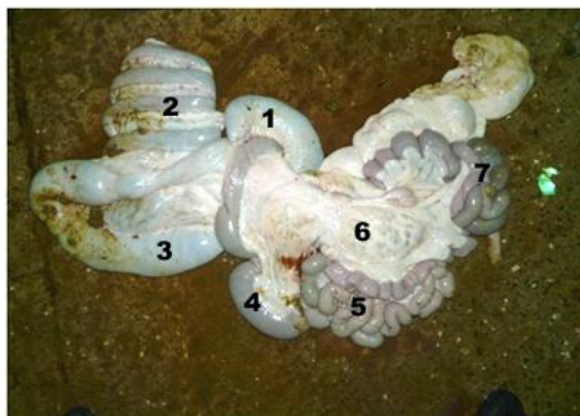
Figure 4 : intestins du dromadaire (Faye, 2001)

Le jéjunum est la partie la plus longue de l'intestin grêle avec de très nombreuses circonvolutions liées entre elles par le mésentère. L'iléon est la partie distale, légèrement plus large que le jéjunum, avec moins de circonvolutions et séparée du colon (le gros intestin) par le caecum.