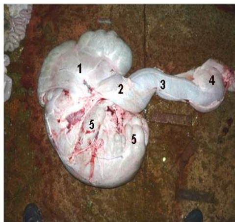
Figure 3 :pré-estomacs du dromadaire ( Faye , 2001 )

L'estomac du chameau a plus d'un mètre de long et a plusieurs fonctions. Il comprend trois compartiments principaux (figure 3): le sac du rumen, le réticulum et un troisième avec une forme intestinale comprenant le feuillet (omasum) et la caillette (abomasum), difficile à distinguer par leur aspect macroscopique. Ce qui au final donne au chameau une anatomie digestive un peu différente de celle des autres ruminants, munis eux, de 4 estomacs. Par ailleurs, des différences sont observées aussi sur le plan fonctionnel avec l'estomac de vache ou de brebis. Les anatomistes décrivent un estomac du chameau composé d'un grand compartiment dit C1 (correspondant à la panse ou rumen) qui est divisé par une bride transversale musculaire dorsale puissante entre la partie crâniale et la partie caudale, un compartiment relativement petit de forme de rein dit C2 (correspondant au réseau ou réticulum), pas complètement séparée du C1, un compartiment tubulaire C3 (comme le feuillet) qui provient du C2, situé sur le côté droit du rumen et consistant en un long tube de forme intestinale avec une partie distale légèrement distendue. L'acide chlorhydrique (HCl) est produit uniquement dans la dernière poche (correspondant à la caillette) qui n'est pas clairement séparée extérieurement de C3. Les parties ventrales de C1 et C2 sont constitués de sacs glandulaires, particulièrement proéminents entre les brides musculaires caudales de C1 (Lechner-Doll et al., 1995).