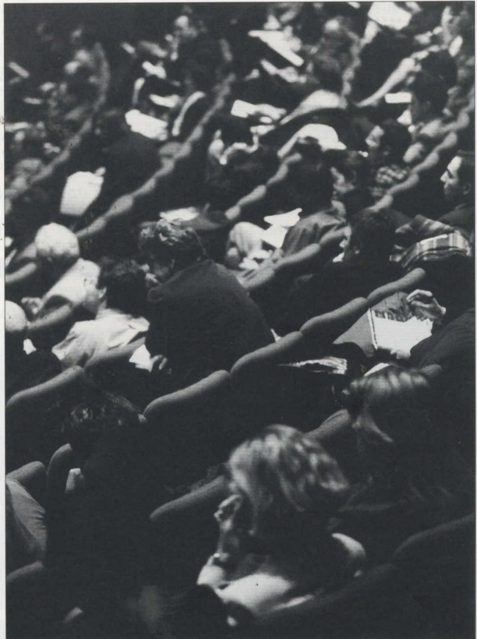
Table ronde P. 57

■ Organizing and financing development Page 56