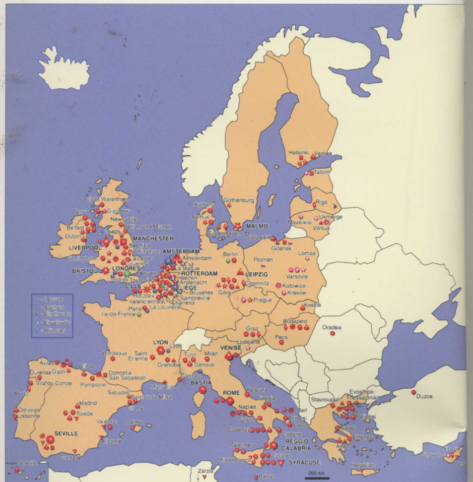
Carte de synthèse des réseaux, groupes de travail, études

Brigitte Brück , coordinatrice du réseau ECO-FIN-NET, Leipzig 26