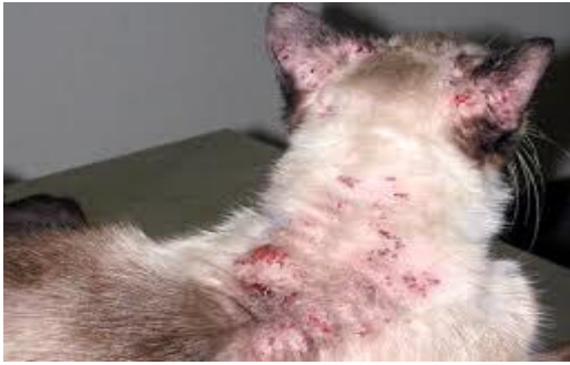
Figure13 :La dermatite allergique aux piqûres de puces, chat