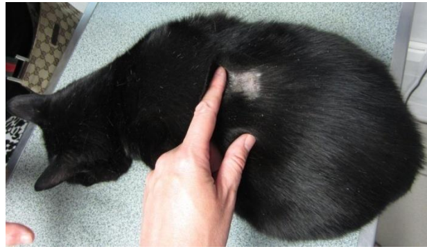
Figure 9 : Lésion de plus grande taille, au milieu du dos d'un chat