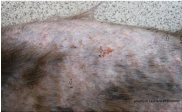
Figure 14 : un chien atteint d'une DAPP. (37).