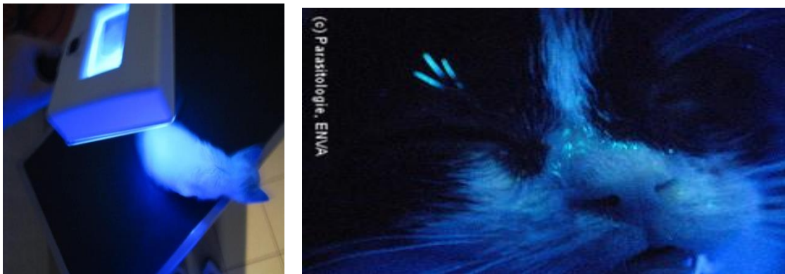
Figure 10 : Examen sous lumière de Wood (ultra-violette) : fluorescence des poils parasités par Microsporum canis (29)

A. Examen en lampe de Wood (ultraviolet) : les poils montrent une fluorescence jaune vert en présence de souches de Microsporum canis . Cet examen de dépistage est facile, mais des résultats faux négatifs et faux positifs sont fréquents. (13)