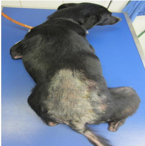
Figure 16. Aspect et localisation typiques des lésions dues aux piqûres de puces chez une chienne labrador (38).

5/ après que le chien ait eu une dermatite par allergie aux puces pendant des années, la peau des régions atteintes devient dépilée, épaissie, grise et plissée.