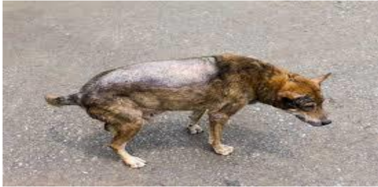
Figure 15 : Chien souffrant d'un prurit, erythème et alopecie dans la région lombaire. (38) .