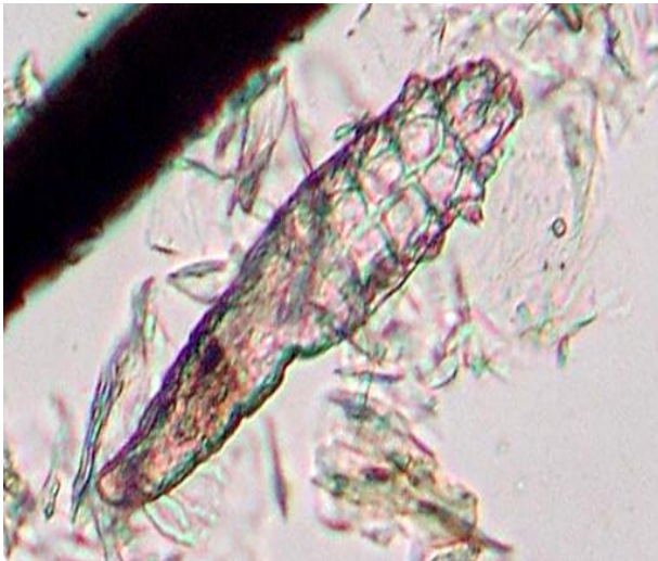
Figure 4 : Demodex canis observé au microscope après raclage cutané