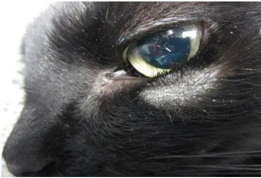
Figure 8 : Aspect caractéristique d'une lésion de teigne, sur la face d'un jeune chat : lésion ronde, assez bien circonscrite, squameuse et dépourvue de poils.