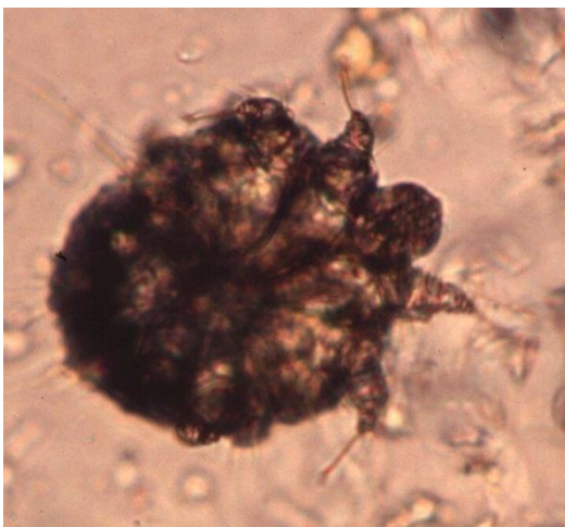
Figure 6 : sarcoptes scabiei var. canis et ses œufs sous microscope (34)