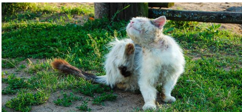
Figure 7 :Un chat atteint d'une teigne