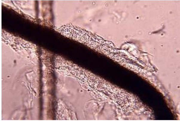
Figure 11 : Spores de Microsporum canis en manchon sur un poil (microscopie optique) (29)