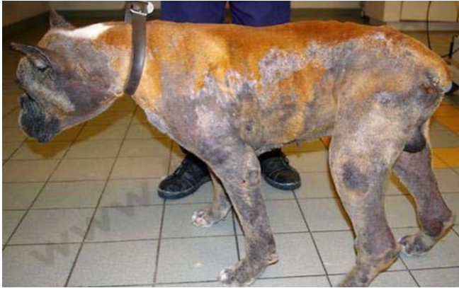
Figure 5 : Chien atteint d'une dermatite étendue avec dépilations, squames, croûtes (34)

Elle est caractérisée par de l'érythème, des papules, de l'alopecie et la formation de petites croûtes hémorragiques. Le prurit intense entraîne des traumatismes provoquant des excoriations, et production d'une infection bactérienne secondaire sur les régions excoriées.