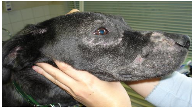
Figure 2 : Démodécie de la face chez un jeune chien

. Lorsque la maladie est contrôlée, les poils recommencent à pousser dans les trente jours. Les récurrences sont rares après, car la peau semble être devenue un milieu défavorable à une reproduction rapide des acariens. (14)