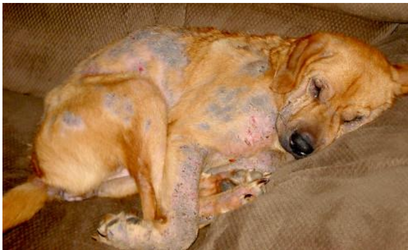
Figure 3 : Démodécie généralisées chez un chien

Certains propriétaires demandent l'euthanasie de leur chien en raison du caractère rebelle de l'affection parvenue à ce stade. . (10)